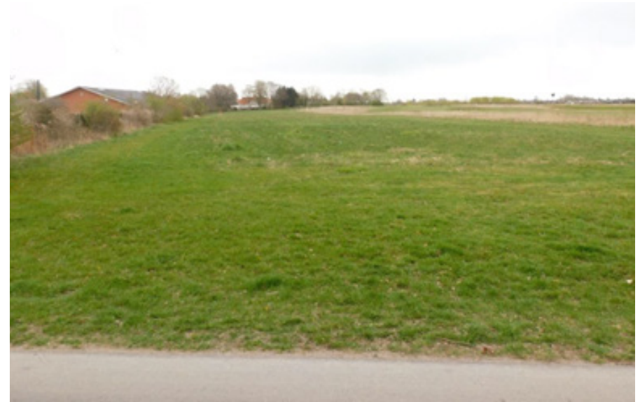
Slået kommunalt græsareal ved Ishøj Gaard. Mindre græsarealer som disse tænkes ind i en slåningsplan.

ØKONOMI: Der er bevilliget midler gennem ”Puljen til mere natur, træer og oaser” til udarbejdelse af naturfremmende slåningsplan i 2023.