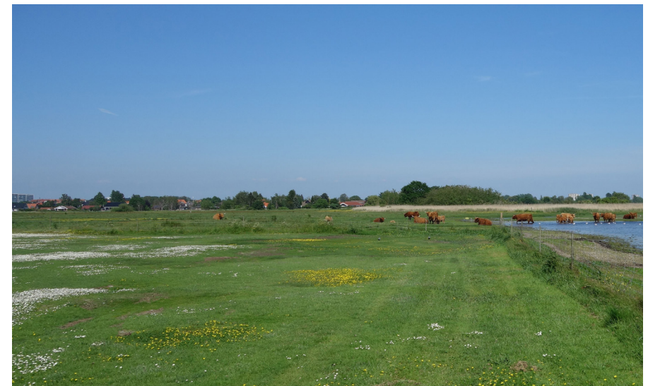
Foldhegningen (th. på foto) flyttes så de sydligste boldbaner i fremtiden indgår i naturområdet.