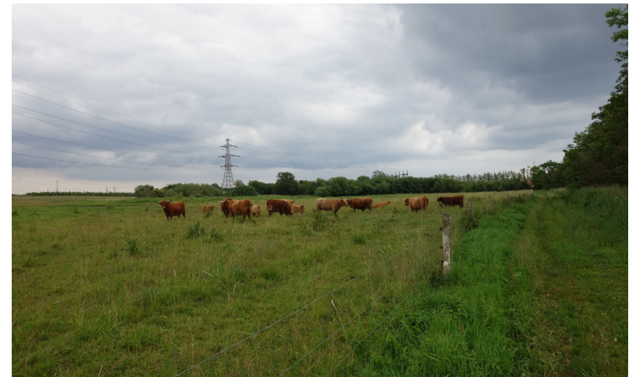
Skotsk højlandskvæg græsser på areal i Lille Vejleå dalen, hvor vandløbet med fordel kan genslynges.