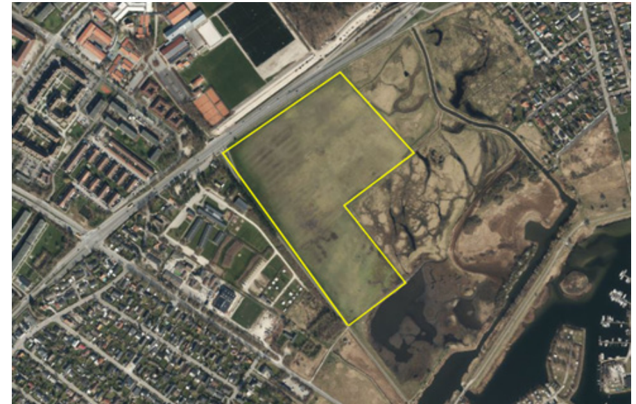
Boldbanerne fylder meget det åbne landskab. Gul angiver boldbanernes udbredelse.

Hvis projektet skal igangsættes, kræver det, at det prioriteres i forbindelse med de kommende års udmøntning af "Pulje til mere natur, træer og oaser" eller ved en budgetforøgelse til området.