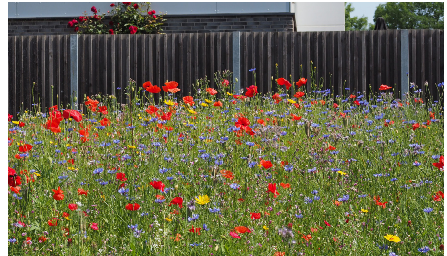
I Vildtbanegården er der bl.a. etableret blomstereng på nogle af boligselskabets arealer.