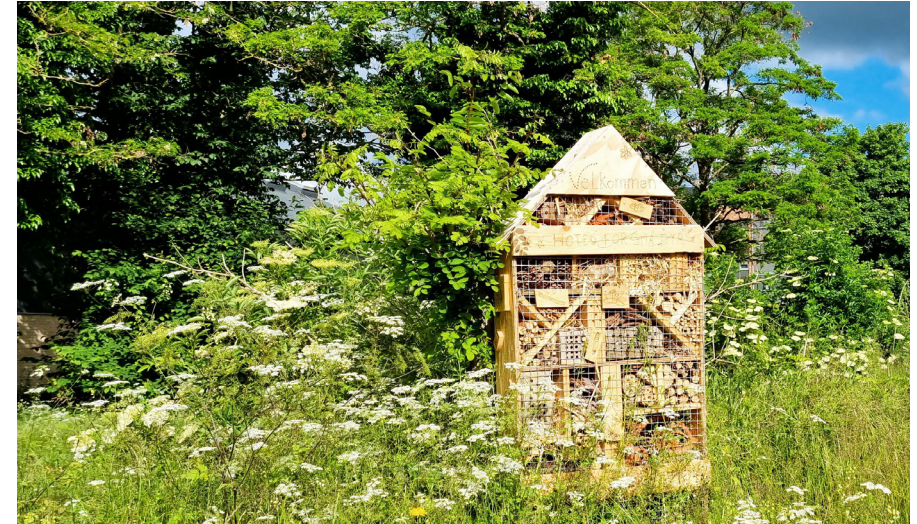
Flere initiativer er gjort for at forville Strandgårdskolens udearealer, bl.a. at ændre slåningen i området og lave insekthotel.

SAMARBEJDSPARTNERE: Borgere, grundejerforeninger, interesseforeninger mv.