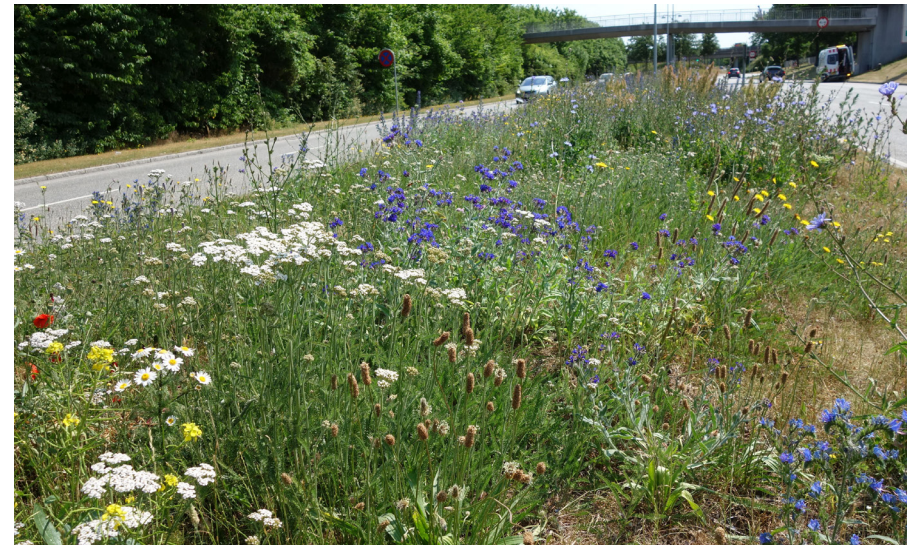
Udsået hjemmehørende blomsterblanding på midterrabat på Stationsvej.