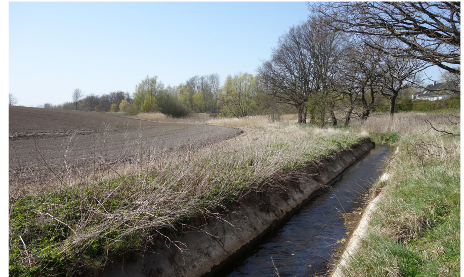
Lille Vejleå er på flere strækninger udrettet og flisebelagt, hvilket giver ringe levevilkår for plante- og dyreliv.

SAMARBEJDSPARTNERE: Greve, Høje Taastrup og Ishøj Kommuner samt de tre forsyningselskaber.