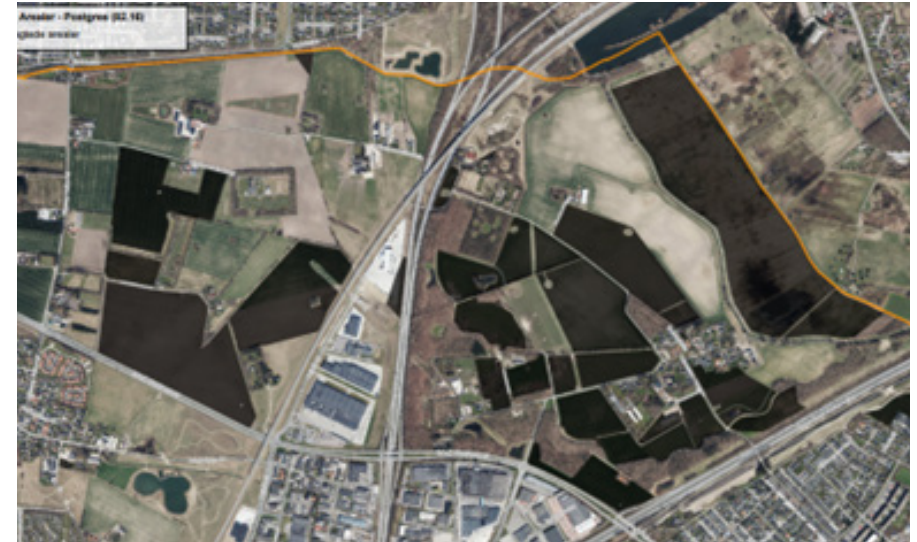
Oversigtskort over grønne kommunale arealer, hvor en del er bortforpagtet.

ØKONOMI: Der er bevilliget midler gennem "Puljen til mere natur, træer og oaser" til udpegnings og visionsplan for projektet i 2023. Hvis de enkelte indsatser skal igangsættes, kræver det, at det prioriteres i forbindelse med de kommende års udmøntning af "Pulje til mere natur, træer og oaser" eller ved en budgetforøgelse til området.