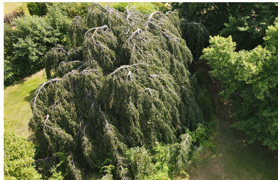
Den gamle hængebøg ved Ishøj Gård er et unikt syn i kommunen.

ØKONOMI: Der er bevilliget midler gennem ”Puljen til mere natur, træer og oaser” til udarbejdelse af plan for mere naturnær skovdrift i 2023 Hvis projektet skal igangsættes, kræver det, at der prioriteres midler i forbindelse med budgetforhandlinger til at dække varigt indtægtstab for manglende salg af brænde.